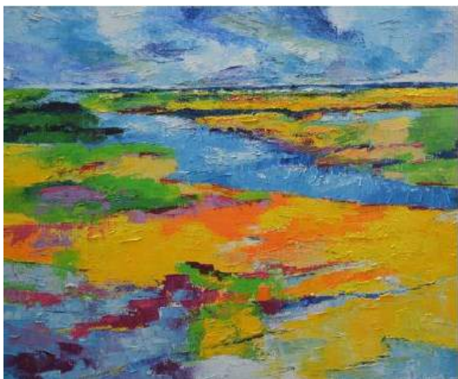
Baie de Somme, Le Cap Hornu - HST - peinture au couteau (2018) 73 x 60 cm

Pascal est un très bon dessinateur il aime aussi les couleurs vives et pures. Il y a de l'expressionnisme dans ses compositions mais aussi une vibration une tendance fauviste dans sa démarche.