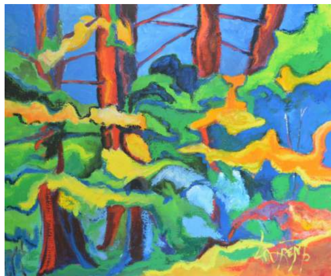
Périgord Noir - HST 65 x 54 cm

Pascal Laurent 26 avenue du Maréchal Foch 91440 Bures-sur-Yvette 06 88 29 93 35 N° MDA : L 648089 atelierlaurentpeintre@gmail.com https://sites.google.com/site/laurentpeintre/