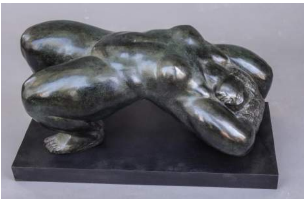
Le Pont, bronze, 23 X 51 X 23 cm

En 1916 il est admis à l'école des Beaux-Arts dans l'atelier d'Antonin Mercié et en 1921 à l'école des Beaux-arts, à titre définitif, dans l'atelier de Jean Boucher dont il apprécie l'enseignement.