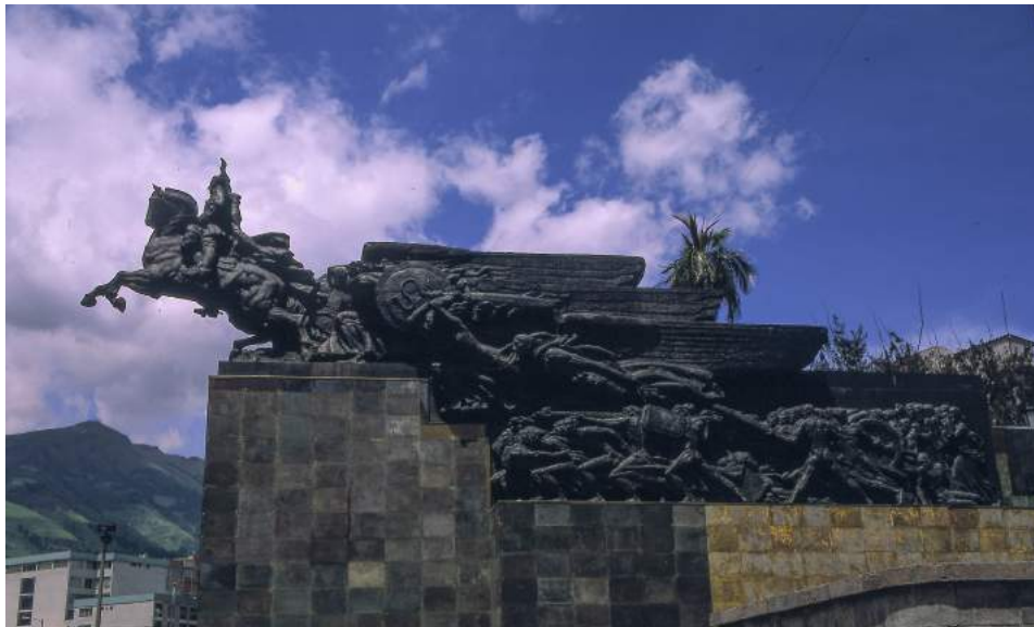
Monument Simon Bolivar , 1935 à Quito, Equateur, bronze 10,5 x 12,6 x 3,15 m .

Ainsi il me forma de Maître à disciple durant les dernières années de sa vie, et je puis transmettre à mon tour, grâce à mon expérience de praticien, à mes reportages photographiques de ses travaux en cours d'exécution, et à mes notes d'atelier à ses côtés, ce qui fut peut-être les dernières manifestations d'une pratique de la sculpture sur le point aujourd'hui de sombrer dans l'oubli le plus total. Comble du paradoxe, c'est Pierre Restany, la figure de proue du Nouveau Réalisme, qui signera la monographie éditée par le Cercle d'Art, et qui servit de catalogue à l'exposition de Sceaux... peut-être pour se faire pardonner post mortem?